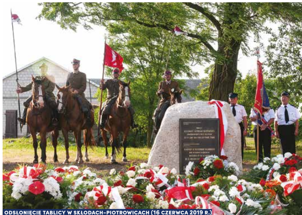
ODŚWIEŻENIE TABLICY W SKŁODACH-PIOTROWICACH (16 CZERWCA 2019 R.)