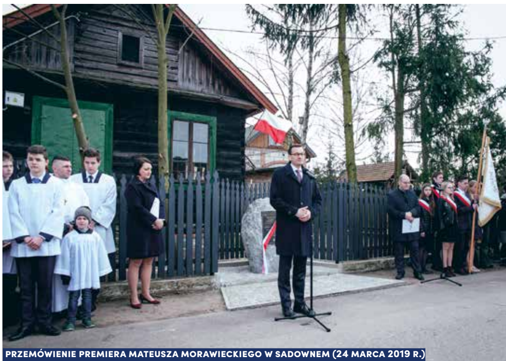
PRZEMÓWIENIE PREMIERA MATEUSZA MORAWIECKIEGO W SADOWNEM (24 MARCA 2019 R.)